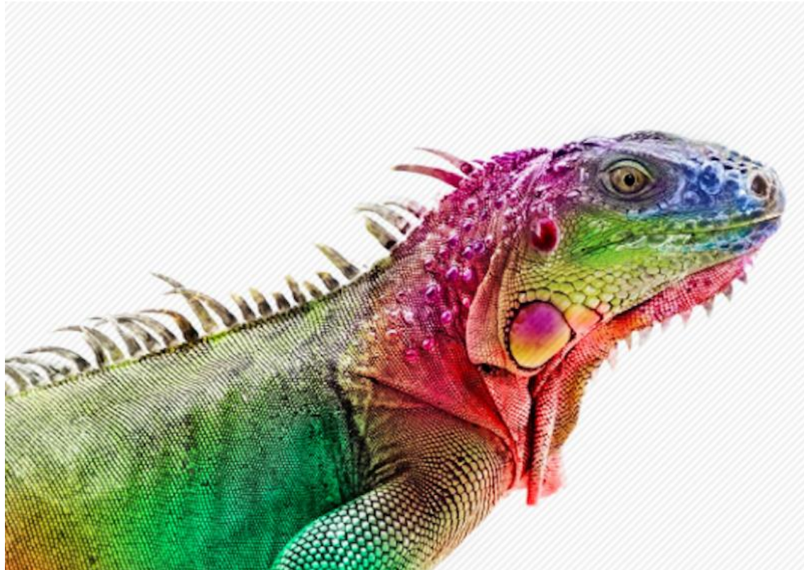
Das :spectrum Ausbildungskonzept basiert auf dem wissenschaftlichen Konstrukt von XLNC Leadership Diagnostic